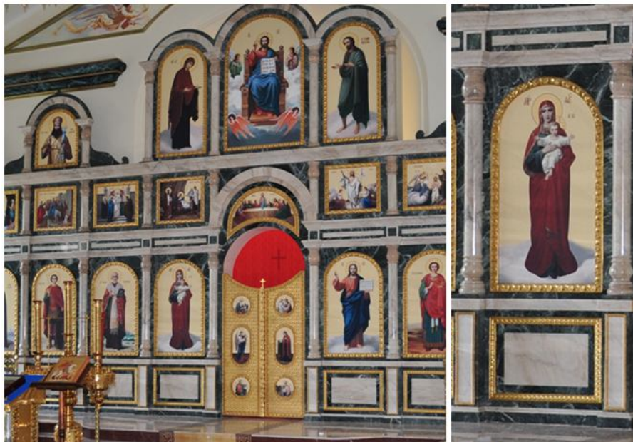
Каменный иконостас, Храм Святого Пантелеймона, Воронеж

В Церкви Сергия Радонежского в Бибиреве стал главным напольным покрытием помещений.