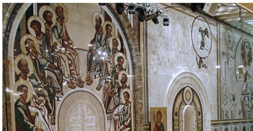
Фрагмент панно Зала Церковных Соборов, Храм Христа Спасителя

святые, начатую ещё при воссоздании Храма Христа Спасителя в Москве. Уже тогда из саянского мрамора, ставшего своеобразной визитной карточкой компании, был выполнен большой комплекс работ - произведена облицовка стен, изготовлены компоненты для внешней и внутренней отделки, выполнены элементы Иконостаса и монументального панно «Двенадцать апостолов» (площадью около 800 м 2 ) для Зала Церковных Соборов. С тех пор у реставраторов и строителей храмов саянский мрамор стал наиболее востребованным среди всего ассортимента отделочных материалов холдинга.