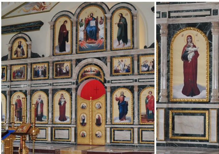
Каменный иконостас, Храм Святого Пантелеймона, Воронеж

В Церкви Сергия Радонежского в Бибиреве в Москве стал главным напольным покрытием помещений.