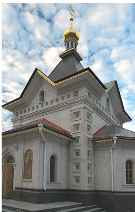
Покровский Храм, Долгопрудный

Настоящим апофеозом саянскому мрамору стала построенная с помощью холдинга в 2004-м году Покровская церковь в подмосковном городе Долгопрудный.