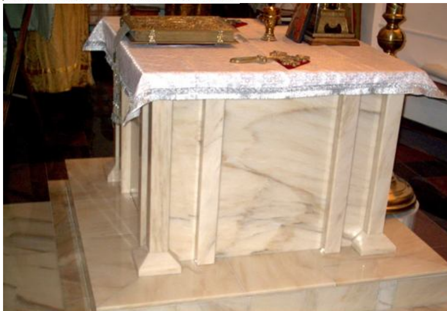
Алтарь, Храм Владимирской области

А лучшими подоконниками в Храме Святого Апостола Иакова Зеведеева в Казенной Слободе в Москве признали исключительно подоконники из саянского мрамора. Не меньшей популярностью наш материал пользуется и при